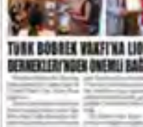
Türk Böbrek Vakfı'na Lions Dernekleri'nden önemli bağış