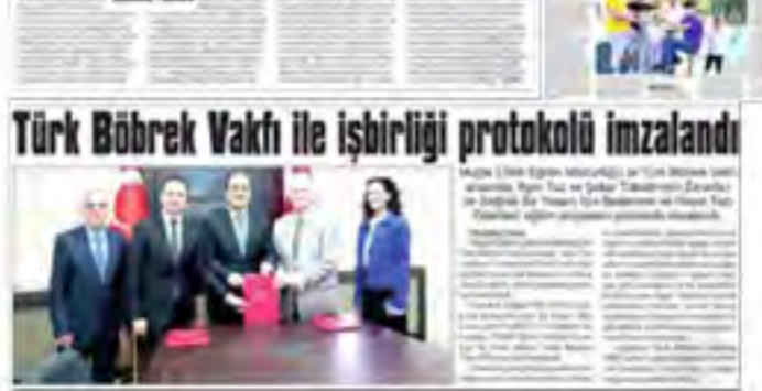
Türk Böbrek Vakfı ile işbirliği protokolü imzalandı