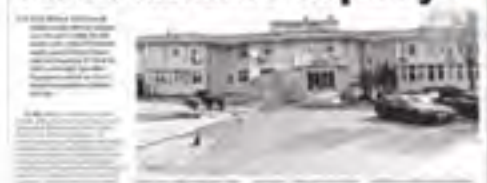
Böbrek hastalarına can veren hastane kapanıyor