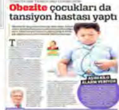
Obesite çocukları da tansiyon hastası yaptı